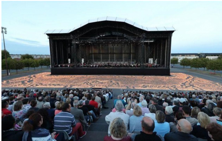
Melun, samedi 8 septembre. Département de Seine-et-Marne

Le spectacle Les Lumières de la Paix a réuni musique et illuminations à Melun, le 8 septembre.